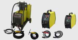
TIG AC/DC (Inverter)