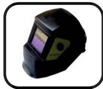
ماسک الکترونیک Electronic mask