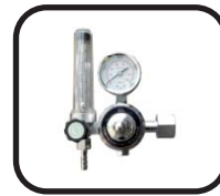
رگولا تورو هیتر گاز Regulator and gas heater