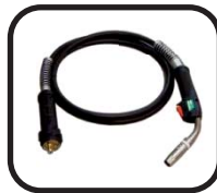
تورچ هواخنک Air cooled Torch