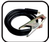
کابل جوشکاری با گیره اتصال به قطعه کار Welding cable including earth clamp