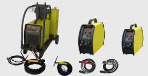
TIG AC/DC (Inverter)