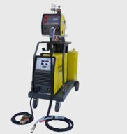
TIG DC (Inverter)