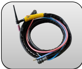
تورچ هوا خنک یا آب خنک Air cooled or water cooled Torch