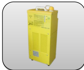
یونیت آب خنک Cooling unit