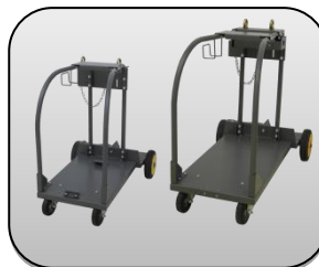
حمل کننده مدل "BT" یا "S" Carriage type "BT" or "S"