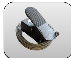
پدال پای Foot pedal