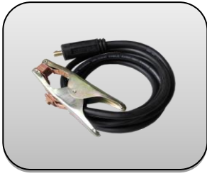
کابل جوشکاری با گیره اتصال به قطعه کار Welding cable including earth clamp