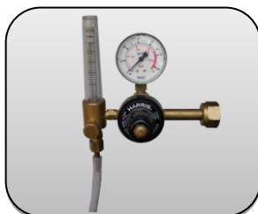
رگولاتور گاز Gas regulator