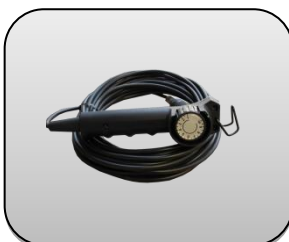
ریموت کنترل Remote Control