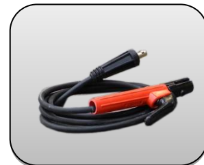
انبر جوش به همراه کابل آن Electrode holder with cable