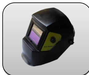
ماسک اتومات جوشکاری Automatic welding helmet