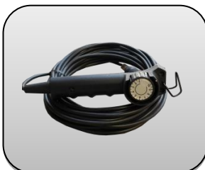
ریموت کنترل Remote Control