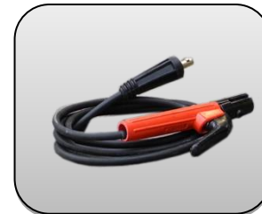
انبر جوش به همراه کابل آن Electrode holder with cable