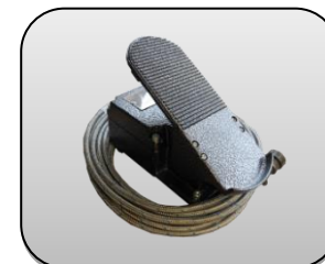
پدال پای Foot pedal