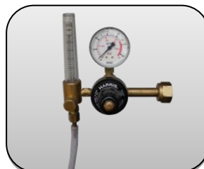
رگولاتور گاز Gas regulator