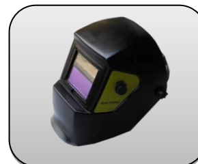
ماسک اتومات جوشکاری Automatic welding helmet